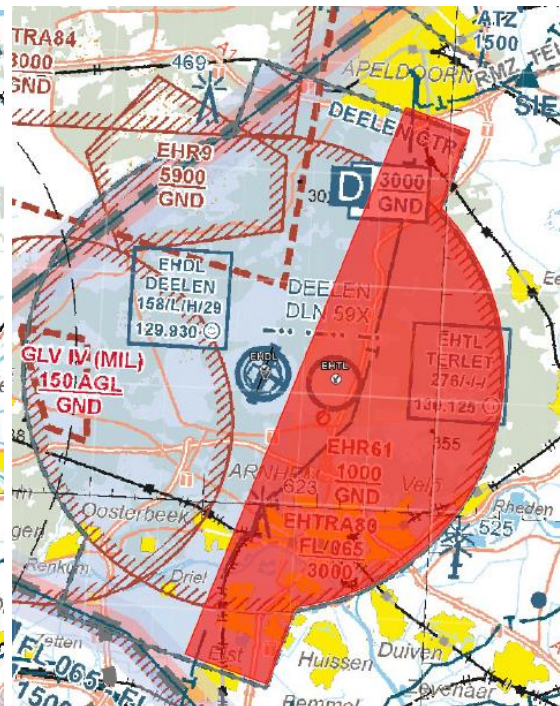
Terlet sector 3.