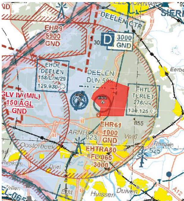
Terlet sector 1.